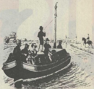
JETJE met haar Mama in de JAAGSCHUIT

Eerst een A, en dan een B. Deze letter heet men, P. Die haar volgt, noemt men een Q Voor de A, staat eerst de U.