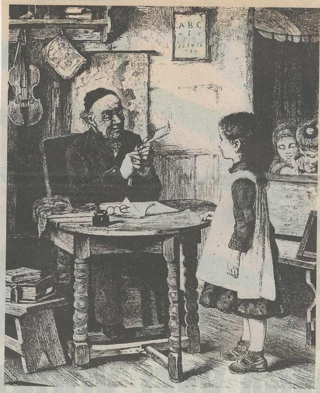
Schrijfles omstreeks 1820.