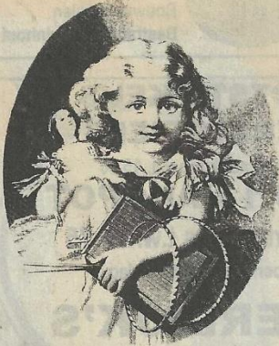
Afbeelding van een schoolmeisje op een convocatie in 1832.

Ds. Niebuur Ferf was naast zijn ambt als predikant, werkzaam als schoolopziener van 1816 tot 1845 in de gemeenten Achtkarspelen, Dantumadeel, Kollumerland en Tietjerksteradeel. Van al zijn schoolbezoeken maakte hij een verslag, die (in kopie) bewaard zijn gebleven. Deze verslagen geven een interessant beeld van het lager onderwijs in de eerste helft van de 19de eeuw.