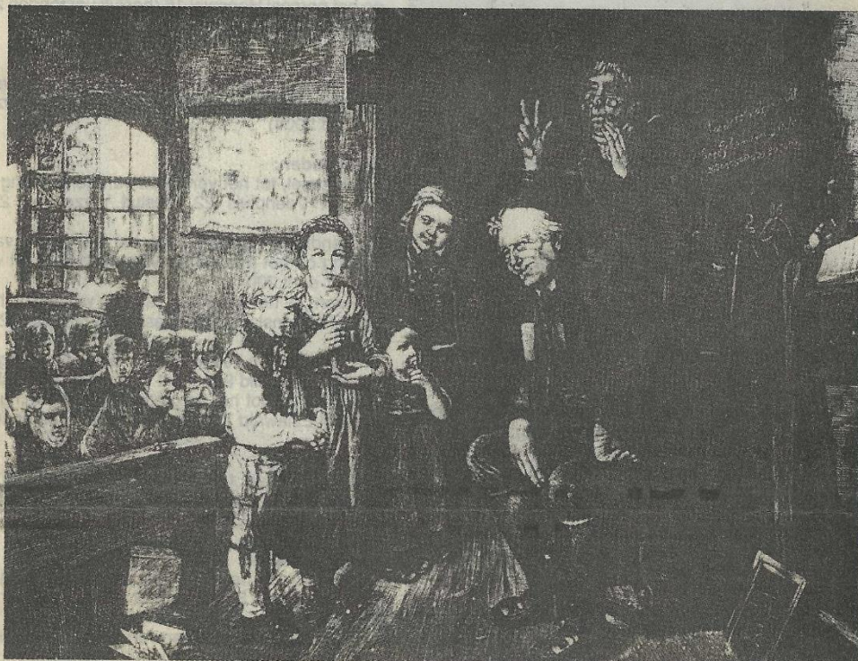
Een schoolopziener op inspectiebezoek omstreeks 1870.