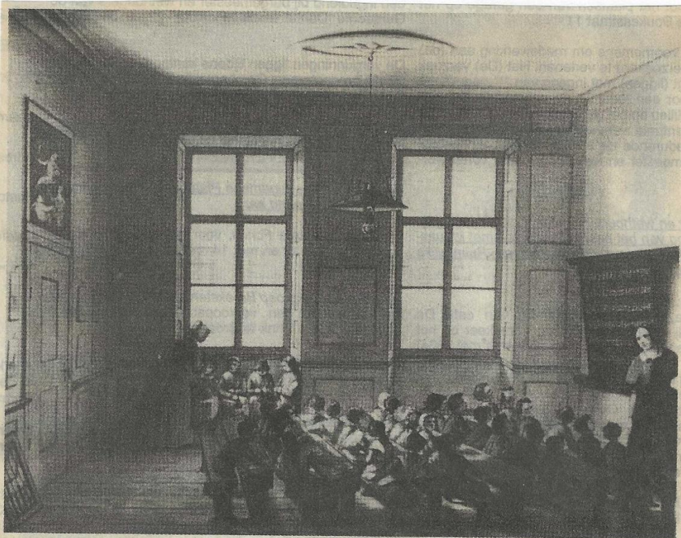
Een schoolklas omstreeks 1850. De onderwijzeres (rechts) is bezig met behulp van op het bord getekende punten de kinderen het tellen te leren. Op de achtergrond bij de ramen ziet men de handwerkjuf met enige leerlingen de beginselen van breien, naai- en speldwerk aan te leren.

Titelplaat van een Haneboekje: 'doch zoo ze eenige vordering maken, krijgen ze een A-B-C-boek, waarin het prentje met Hanepik en dat met den Schoolmeester, dat op zwaar papier gedrukt is'. De haan werd meestal door een deugdame opwekking opgevolgd, bijvoorbeeld onder het motto: 's-Morgens den Haan zijn ijver bewijst. Leert, jonge jeugt, dat men u ook so prijst.' Dergelijke 'Haneboekjes' werden lange tijd bij het onderwijs gebruikt. In een andere druk lezen we: Een kind, dat goed leert, Niet vloekt en niet zweert,