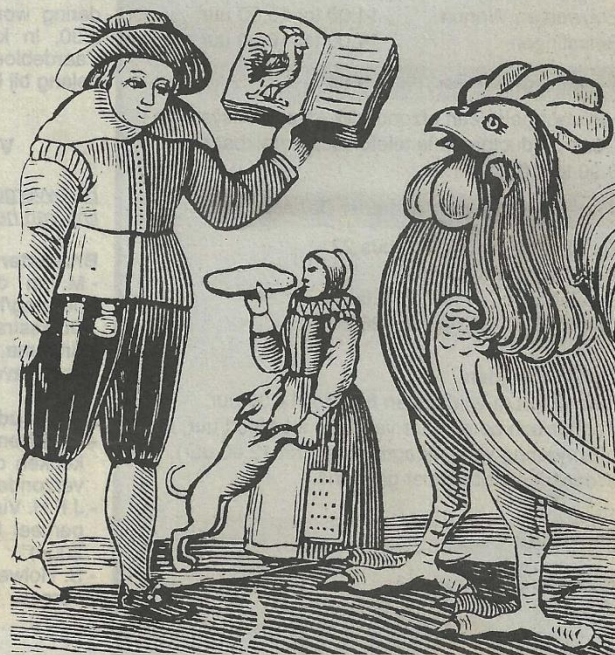
Titelplaat van een Haneboekje. De haan werd in het boek meestal door een deugdame opwekking opgevolgd, bij voorbeeld onder het motto: 's-Morgens den Haan zijn ijver bewijst, Leert jonge jeugt, dat men u ook so prijst'. Deze boekjes werden lange tijd in de 19de eeuw bij het onderwijs gebruikt.

Titelplaat van een Haneboekje: 'doch zoo ze eenige vordering maken, krijgen ze een A-B-C-boek, waarin het prentje met Hanepik en dat met den Schoolmeester, dat op zwaar papier gedrukt is'. De haan werd meestal door een deugdame opwekking opgevolgd, bijvoorbeeld onder het motto: 's-Morgens den Haan zijn ijver bewijst. Leert, jonge jeugt, dat men u ook so prijst.' Dergelijke 'Haneboekjes' werden lange tijd bij het onderwijs gebruikt. In een andere druk lezen we: Een kind, dat goed leert, Niet vloekt en niet zweert,