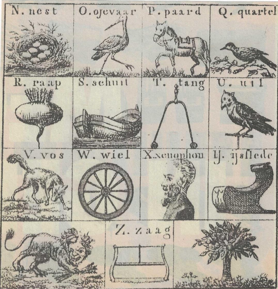
Gebruikte spellingsmethode van prof. Siegenbeek rond 1850.